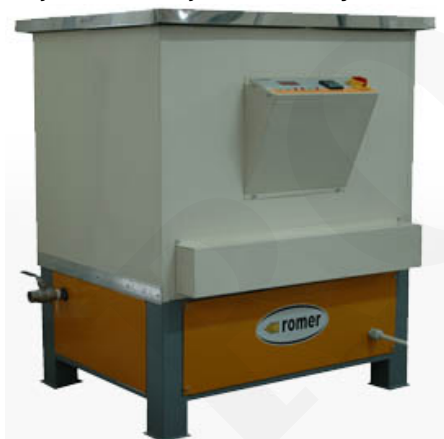
Důležité ultrazvukové zařízení

Najsukuteczniejsze do małych detali, do profesjonalnych rozwiązań