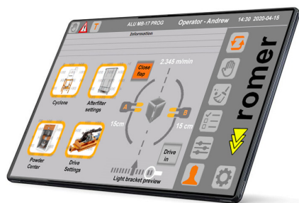
ProfiControl 10" controller

Automatic measurement of element dimensions before coating