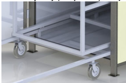
Métodos de transporte

Systemy transportowe do pieców manualnych