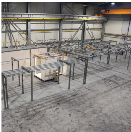
Trawers poprzeczny krzyżowy