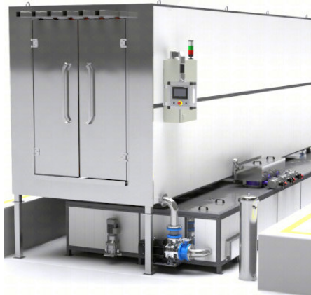
Autolavaggi automatici con asciugatura

Minimalizacja migracji Wysoka wydajność mycia