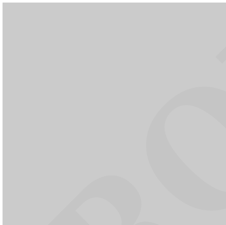
Wykrywanie i tłumienie wybuchu