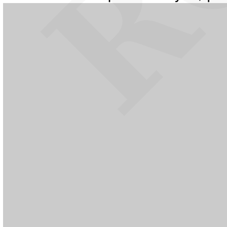
Bramka skanowania powierzchni detalu

Do 12 kanałów pomiarowych, pomiar rozkładu temperatury w piecu