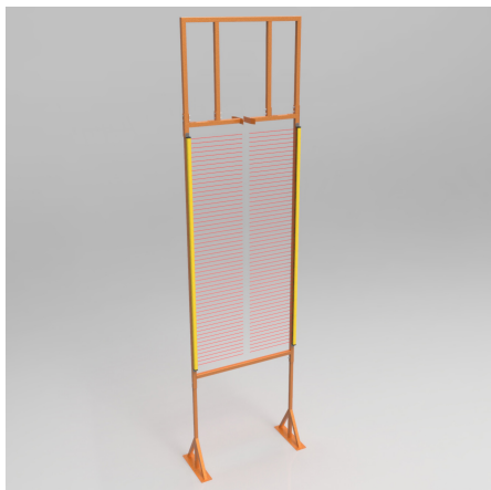
Porte di misurazione del pezzo

Automatyczne pomiary wymiarów elementu przed lakierowaniem