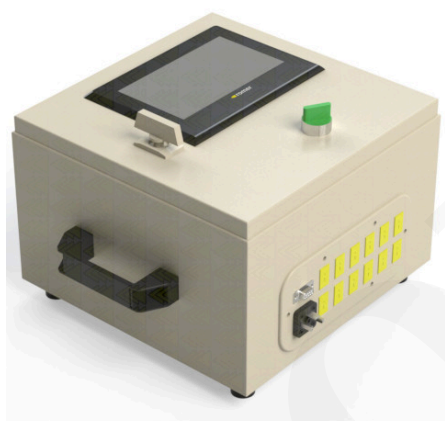
System pomiaru temperatury

zabezpieczenie przed wybuchem podczas suszenia