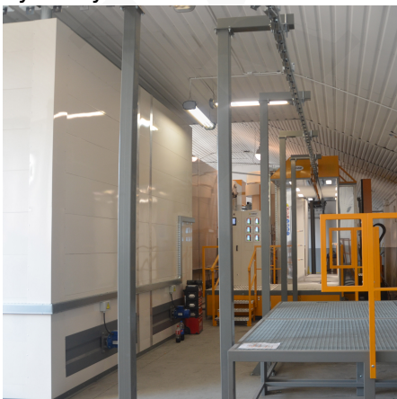
Trasportatori a catena continua