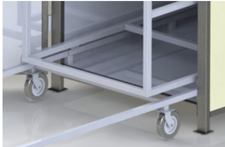
Metodi di trasporto

Systemy transportowe do pieców manualnych