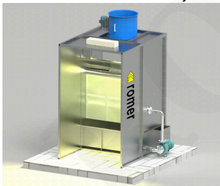
Kabiny mokre ze ścianą wodną