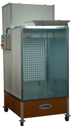
Kabiny mokre z filtracją suchą

Frequente kleurverandering met hoge productiecapaciteit