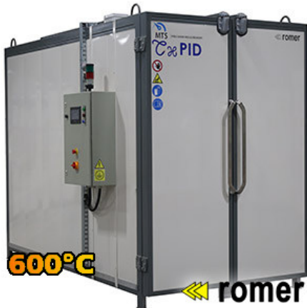
Piecze wysokotemperaturowe do 600°C

Luftsirkulasjon Strømforsyning Presisjon, god temperaturfordeling