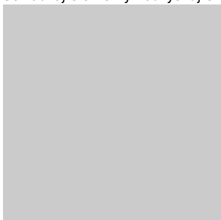
Piece tunelowe modułowe

Wielkogabarytowe rozwiązania dla wymagających