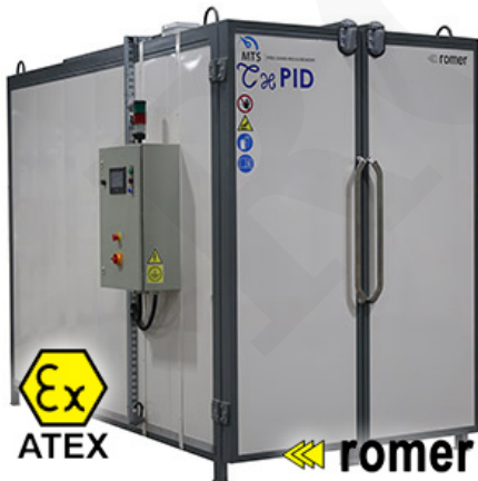
Piecze do suszenia rozpuszczalników

Komora ze stali nierdzewnej Wymuszony obieg powietrza Programowalna krzywa grzania