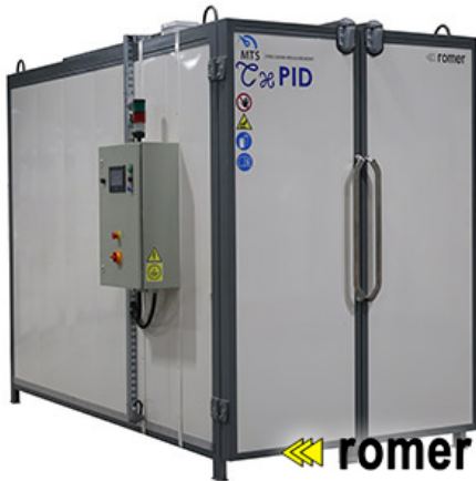
Sirkulasjon elektriske ovner

Luftsirkulasjon Strømforsyning Presisjon, god temperaturfordeling