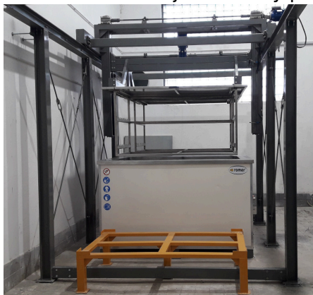
System wanny do strippingu