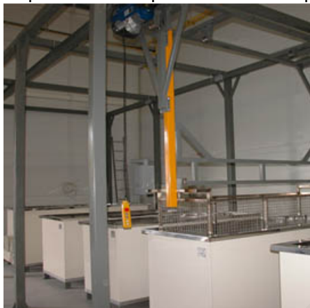
Banhos de imersão

Rápido e eficaz para oficinas de pintura manual